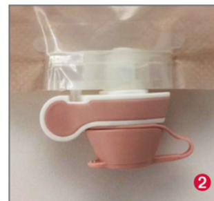
Poche fermée : - Goutte blanche non visible - Symétrie du robinet