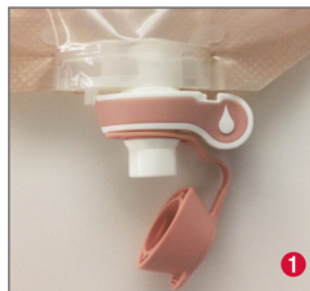
Poche ouverte : - Goutte blanche visible - Asymétrie du robinet